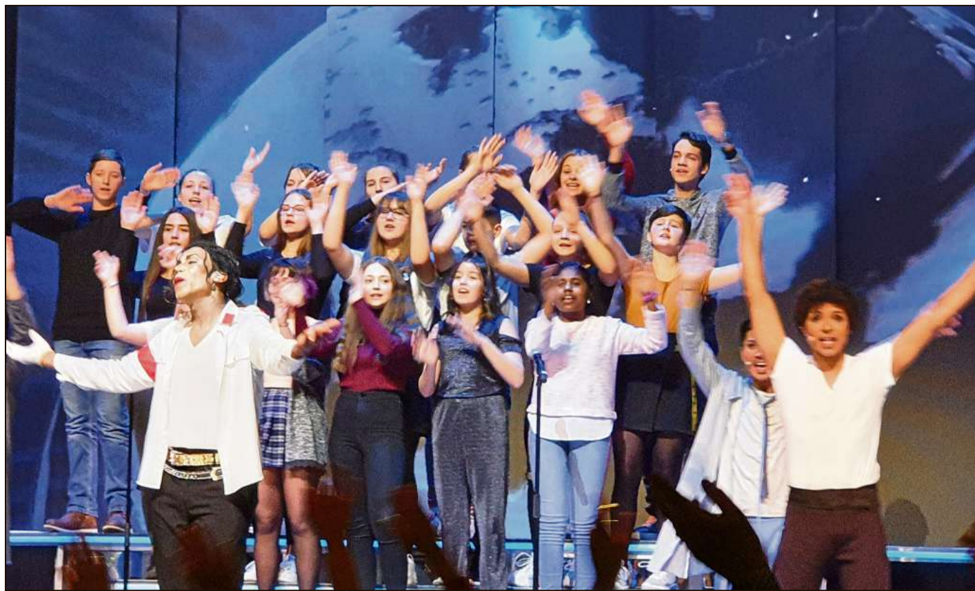
Der King hätte seine Freude gehabt: Großartige Profis und ein großartiger Chor aus Braunschweig.

Die Ehrenamtlichen der Gemeinschaftsgartenprojekte Hofgarten Heydenstraße und Stadtgarten Bebelhof stehen für Fragen rund um den Anbau im Hochbeet zur Verfügung.