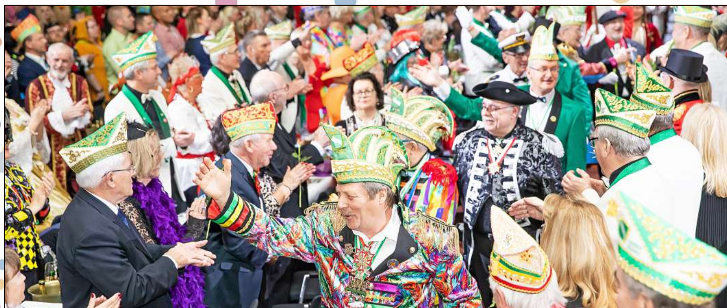
Was für eine farbenfrohe Pracht: Der Einzug der Karnevalisten während der Prunksitzung der Rheinländer in die Stadthalle wurde von den Gästen im Saal umjubelt.