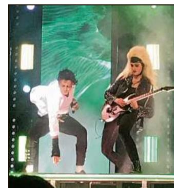
Alles live: Fans des King of Pop kamen voll auf ihre Kosten.