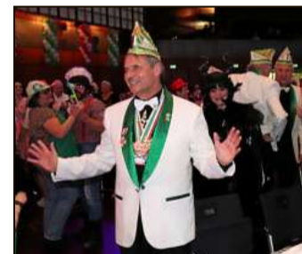
Atemlos durch die Nacht – da gibt es für Oberbürgermeister Ulrich Markurth kein Halten.