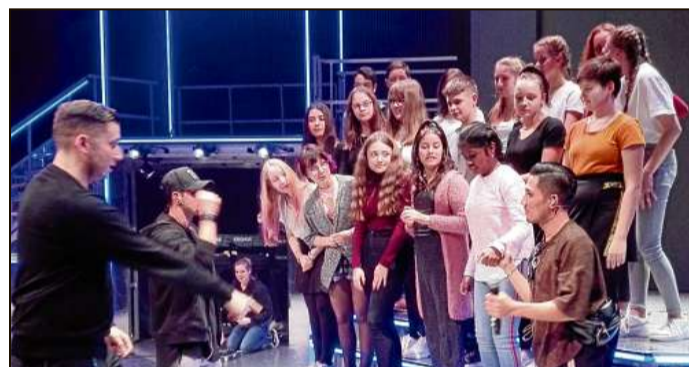
Aufwendige Probe für den Chor der JFK-Realschule. Ganz zum Schluss der Show durften die Schüler mitsingen

Zwar nur für einen Song, aber dafür bestimmten sie das Schlussbild: „Heal the World“ war großes Kino. Für diesen Moment gegen 22.30 Uhr musste die Lehrerin mit ihren 18 Schülerinnen und Schülern bereits um 17 Uhr antreten, es wurde lange geübt, wer steht